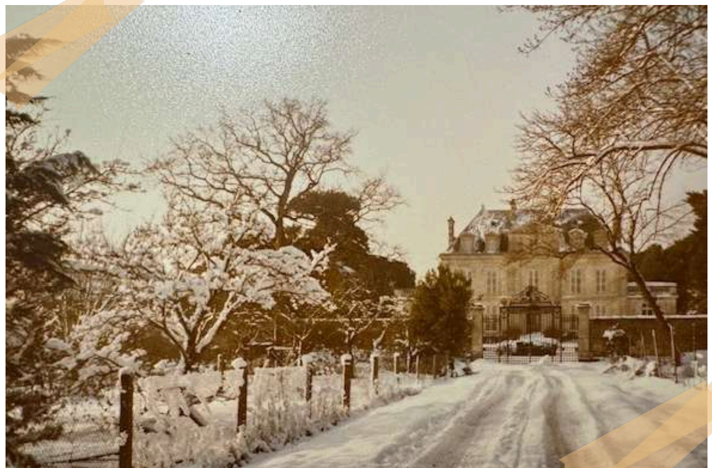
Photographie du Domaine de la Gressière, sous la neige, le 10 Février 1986